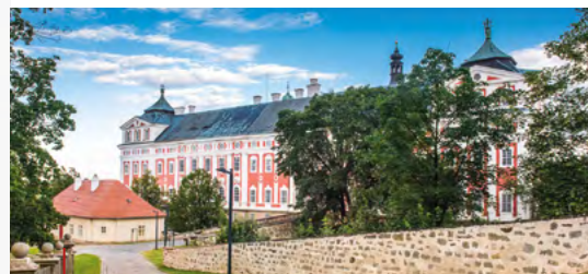
Klášter Broumov