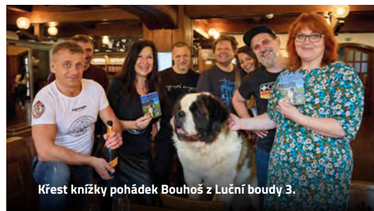
Křest knížky pohádek Bouhoš z Luční boudy 3.

Obživou byly pro obyvatele Luční boudy chov dobytka a sklizeň trávy (senaření). K chatě totiž patřilo zhruba 100 hektarů pastvin a luk a desítky kusů krav a koz. Oblíbeným turistickým místem se stala až s rozvojem cestovního ruchu. Proslavila se blízkostí Sněžky a zemědělskými produkty, obzvlášť horským bylinkovým sýrem.