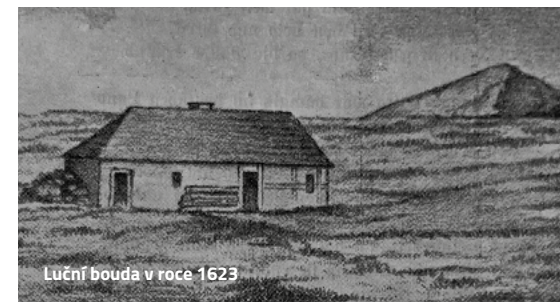
Luční bouda v roce 1623

Klíčové byly dvě renovace v minulém století. Přestavba boudy roku 1914 umožnila ubytování v několika noclehárnách a výrazně zvýšila kapacitu na 100 lůžek. Po velkorysě obnově po ničivém požáru v říjnu 1938 byla chata mnohem větší a nadstandardně vybavená – měla výtah, ústřední topení, větrací šachty a domácí telefon. Nabízela dokonalé zázemí. Němečtí nacisté v ní zřídili armádní výcvikové středisko. Podobu z období druhé světové války má Luční bouda dodnes.