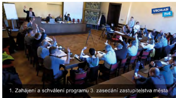
1. Zahájení a schválení programu 3. zasedání zastupitelstva města