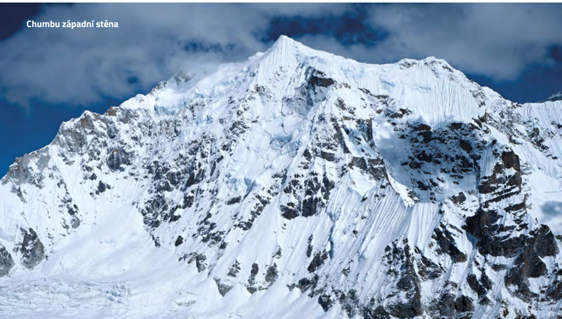
Chumbu západní stěna

Hodně chlapů, co jezdí do hor, celou dobu, kdy jsou v horách, myslí na rodinu, mně přijde až zbytečně moc. Volají si navzájem, takže nejsou tělem a duší úplně v horách. Já to mám s Lindou tak, že když nebudu chtít, vůbec volat nemusím. Nevyžaduje to ode mě a hlavně chce, abych si to tam užil. Samozřejmě se mi po rodině stýská, ale chci maximálně vnímat prostředí, ve kterém jsem. Když se za měsíc vracím domů, těším se a zase se rád vracím sem k nám do České republiky. ■