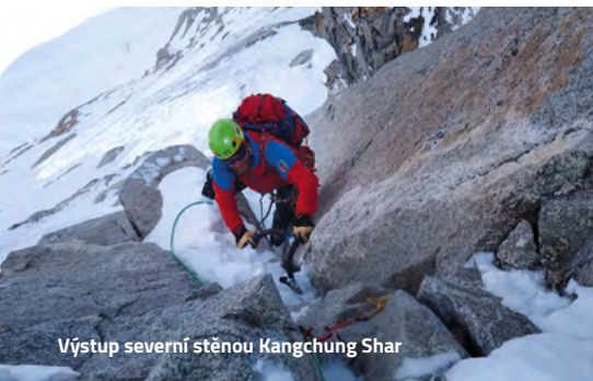
Výstup severní stěnou Kangchung Shar