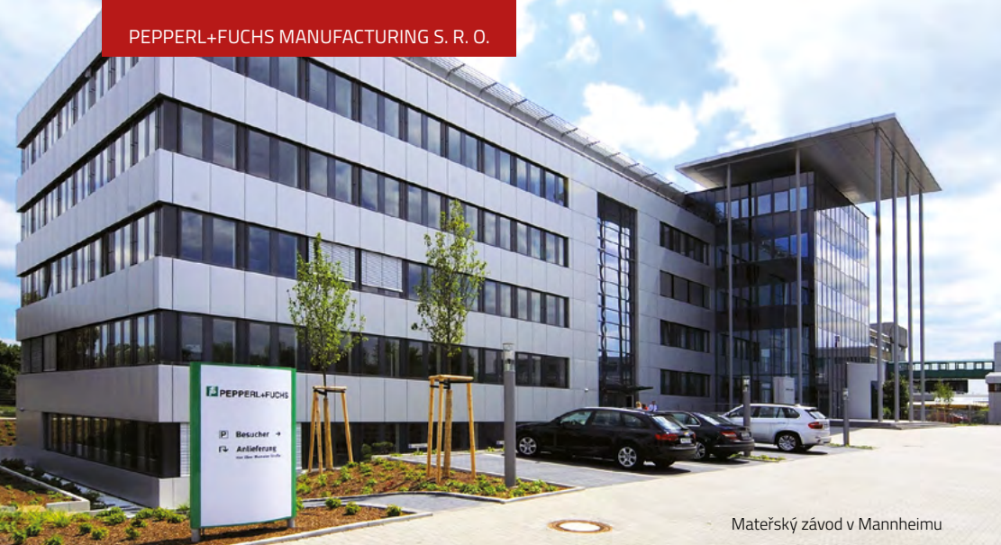
Mateřský závod v Mannheimu