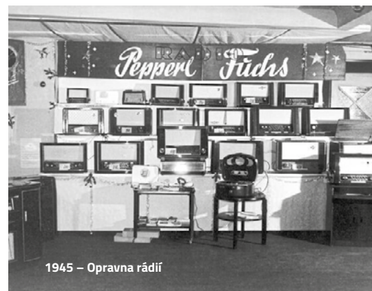
1945 – Opravna rádií

V současnosti je Pepperl+Fuchs globální společností se 7 000 zaměstnanci, s 80 pobočkami na šesti kontinentech, se šesti výrobními závody, z toho jedním v Trutnově, a vyrábí více než 50 000 produktů.