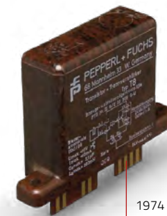
1974 – První elektronický oddělovací spínací zesilovač

Zákazníky jsou převážně výrobní společnosti, ale s některými výrobky se můžete potkat i v běžném životě. Například když budete projíždět přes parkovací závoru, čidlo, které detekuje Váš vůz, aby se následně závora otevřela, a Vy jste mohli pohodlně vjet na parkoviště, bylo s největší pravděpodobností vyrobeno v Pepperl+Fuchs. Za zmínku stojí také spolupráce s českou firmou Průša Research vyrábějící 3D tiskárny. Pepperl+Fuchs vyvinul a vyrábí světově známý „Prusa Induction Autoleveling“ senzor, který je využíván 3D tiskaři po celém světě.